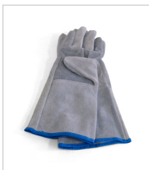
Luvas de couro