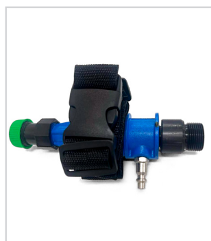
Condicionador de ar