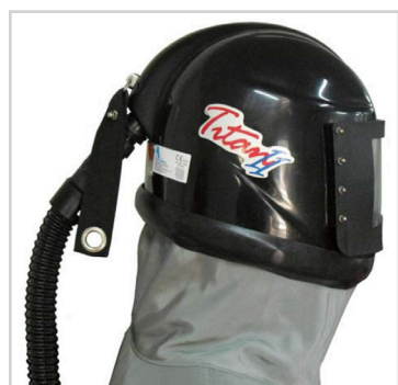
Capacete com sinalizador de pressão mínima Avental

Conjunto de proteção para jatista composto por: