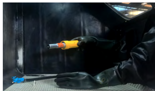
vista interna do gabinete.